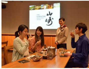
サントリー山崎工場