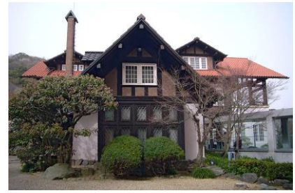
大山崎山荘美術館