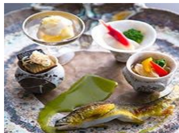
リッツカールトン京都 ランチ