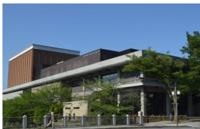
ロームシアター京都