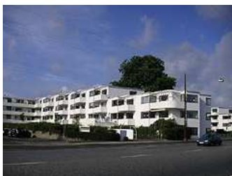
ベルビュー住宅地区