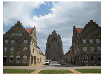
グルトヴィークス教会