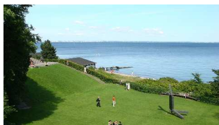
ルイジアナ美術館